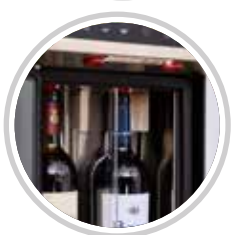
KIT CONFIGURAZIONE ZONA VINI BIANCHI ZONA VINI ROSSI