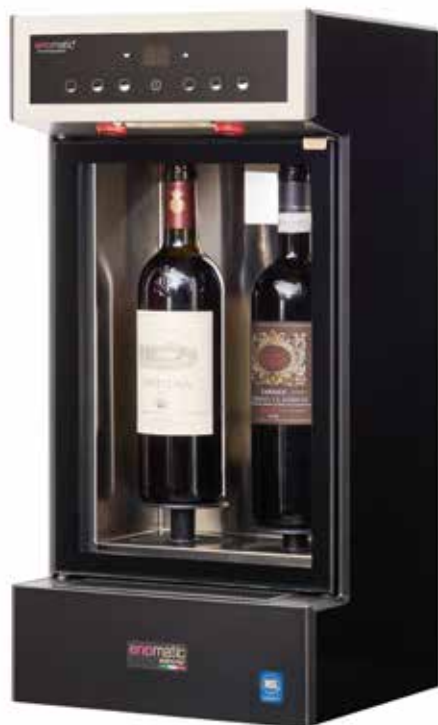
Nota: nella foto è illustrato il modello con il pannello aggiuntivo di colore nero

DESIGN ATTRAENTE E FUNZIONALE. SISTEMA PROFESSIONALE A 2 BOTTIGLIE, REFRIGERATO, COMPATTO, MODULARE, DI FACILE INSTALLAZIONE (PLUG & PLAY). POSSIBILE COLLEGARE PIU' SISTEMI IN LINEA.