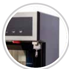
MANIGLIA CON SERRATURA